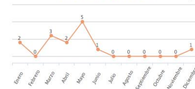
RENOVACIONES DE PÓLIZAS